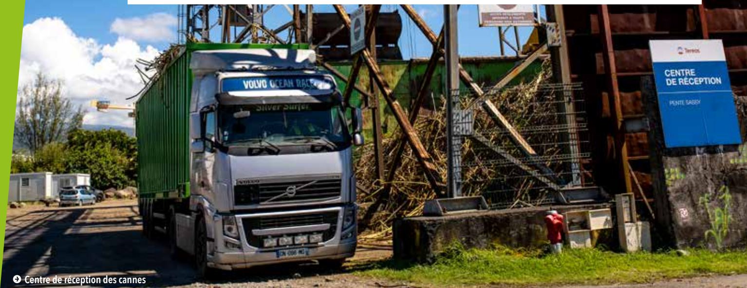
Centre de réception des cannes

LA PROGRAMMATION PLURIANNUELLE DE L'ÉNERGIE (PPE) EST UN DOCUMENT STRATÉGIQUE QUI TRADUIT LA POLITIQUE ÉNERGÉTIQUE FRANÇAISE EN DÉFINISSANT LES ACTIONS PRIORITAIRES DES POUVOIRS PUBLICS POUR LA GESTION DES ÉNERGIES SUR LE TERRITOIRE. DES DISPOSITIONS PARTICULIÈRES ONT ÉTÉ PRÉVUES POUR LE TERRITOIRE RÉUNIONNAIS EN TANT QUE ZONE DITE NON INTERCONNECTÉE À UN RÉSEAU ÉLECTRIQUE CONTINENTAL.