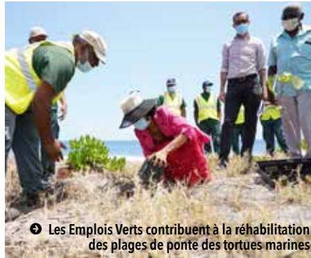
➔ Les Emplois Verts contribuent à la réhabilitation des plages de ponte des tortues marines