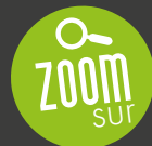
SCHÉMA D'AMÉNAGEMENT RÉGIONAL

Au-delà des dispositifs régionaux pour la lutte contre la précarité énergétique et l'amélioration du quotidien des Réunionnais, (chèque photovoltaïque, dispositif Eco-solidaire, diagnostic SLIME), la collectivité régionale poursuit son engagement à travers la révision de la Programmation Pluriannuelle de l'Énergie et l'accord signé avec EDF et Albioma sur la période 2020-2022, dont l'objectif est d'atteindre près de 100 % d'énergies renouvelables dans le mix électrique réunionnais.