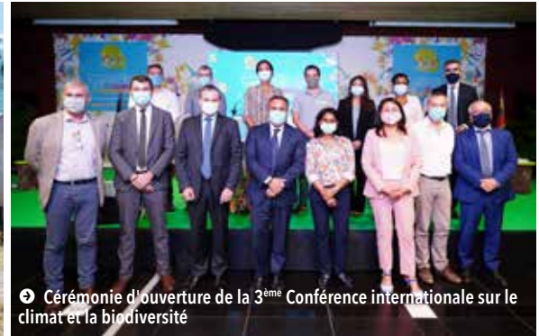
➔ Cérémonie d'ouverture de la 3 ème Conférence internationale sur le climat et la biodiversité

La crise sanitaire que La Réunion traverse, comme l'ensemble du globe, constitue un nouveau révélateur, s'il en était besoin, de la nécessité de concentrer collectivement nos efforts pour un développement durable à l'échelle des territoires, dans le cadre d'un défi qui est d'ordre planétaire.