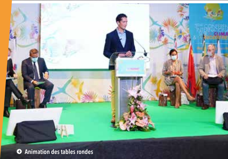
➡ Animation des tables rondes

LE 8 DÉCEMBRE DERNIER À L'OCCASION DE LA JOURNÉE MONDIALE DU CLIMAT, LA RÉGION RÉUNION A ORGANISÉ LA 3ÈME CONFÉRENCE INTERNATIONALE SUR LE CLIMAT ET LA BIODIVERSITÉ. STOPPER L'ÉROSION GRANDISSANTE DE LA BIODIVERSITÉ CONSTITUE UN ENJEU MAJEUR INDISPENSABLE À LA RÉSILIENCE DES TERRITOIRES INSULAIRES, AU REGARD DES EFFETS CONJUGUÉS DE LA GLOBALISATION DES ÉCHANGES SOCIO-ÉCONOMIQUES ET DU CHANGEMENT CLIMATIQUE. PARMIS LES ACTIONS ENVISAGÉES : LA MISE EN PLACE DE L'AGENCE RÉGIONALE DE LA BIODIVERSITÉ À L'ÉCHELLE DU GRAND OcéAN INDIEN.